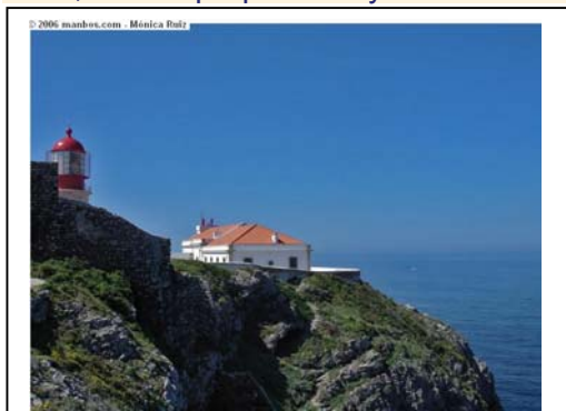
Cabo San Vicente en Portugal, con el faro y edificio histórico de la Escuela de Náutica del siglo XV.

Hacia 1430 los portugueses pasaron hacia el sur el Cabo Bojador que se encuentra algo más al sur de las Islas Canarias. Esa era una de las principales barreras sicológicas que se habían creado los europeos, en las que no faltaban relatos fan-