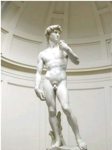
El David de Miguel Ángel.

jar de resaltar el hecho de que por primera vez en casi mil años vuelven a verse desnudos e inclusive los órganos genitales de la personas como parte de una obra artística, que es el caso del David de Miguel Ángel. Es que en toda la edad media el prejuicio del pecado, como se relata en los mitos del Antiguo Testamento, había penetrado todas las actividades oficiales de la cultura, lo que significa que algo grande estaba cambiando y es el poder de la Iglesia como omnipotente y omnipresente.