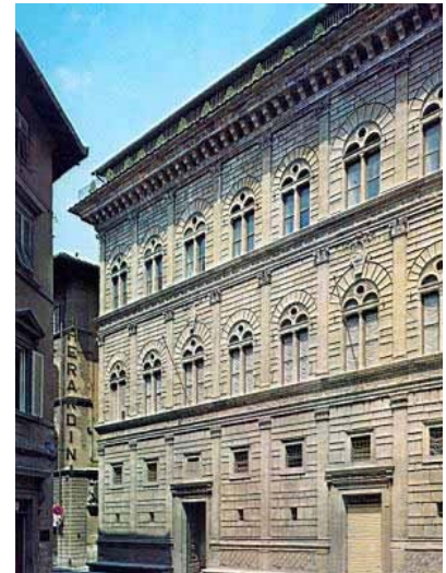
Palacio Rucellai de Mantua

Se puede inferir también de estas obras, que además del arte y la piedad cristiana que continuaron como siempre, nacen otras formas de expresión más mundana, y copiando a la cultura clásica greco romana vuelve el concepto de que 'el hombre es la medida de todas las cosas'.