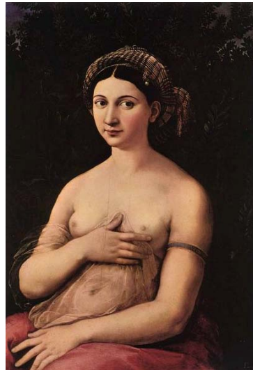
La Fornarina de Rafael