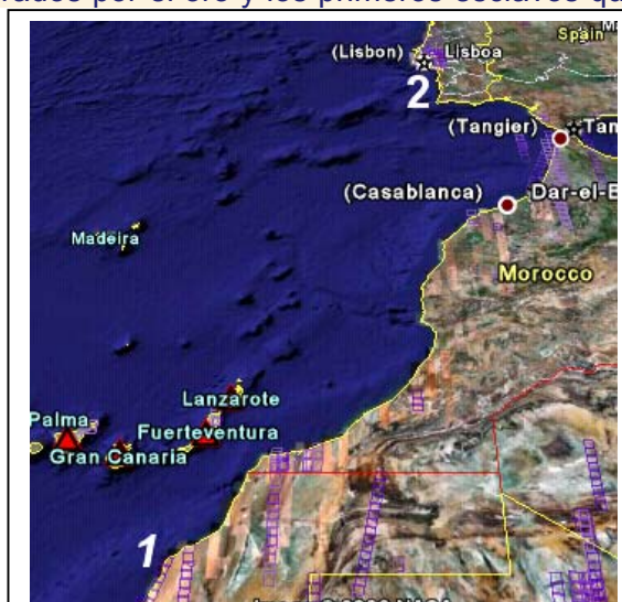
1.- Cabo Bojador, 2.- Cabo San Vicente

conquista y colonización de la mayor parte de las tierras de todo el mundo. Los principales países involucrados fueron España, Portugal, Inglaterra, Francia, Holanda y Dinamarca.